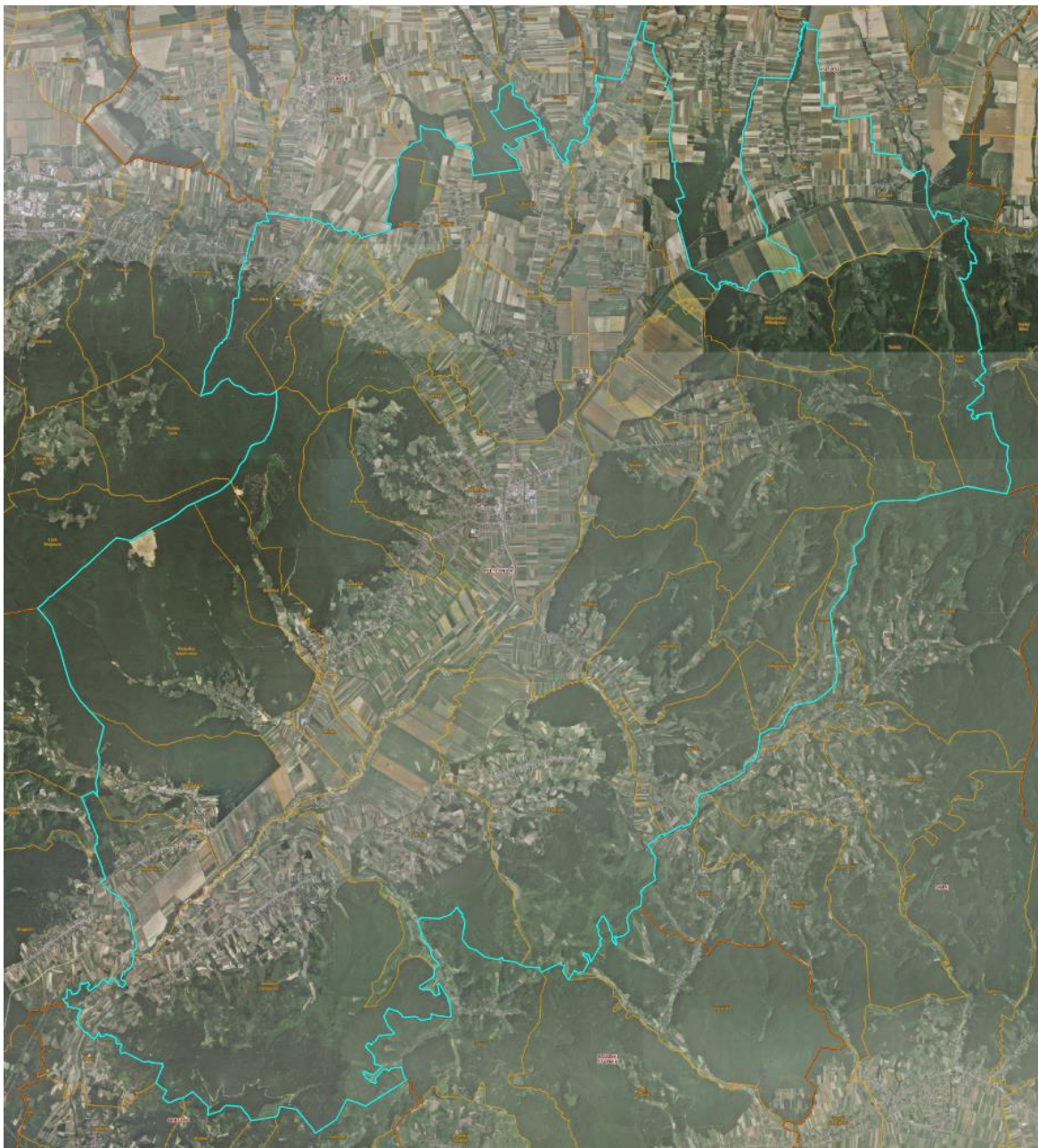
Slika 1: Naselja Grada Pleternice

Grad Pleternica prostire se na površini od 198,13 km 2 i sastoji se od 38 naselja: Ašikovci, Bilice, Blacko, Brđani, Bresnica, Brodski Drenovac, Bučje, Buk, Bzenica, Čosinac, Frkljevci, Gradac, Kadanovci, Kalinić, Knežci, Komorica, Koprivnica, Kuzmica, Lakušija, Mali Bilač, Mihaljevići, Novoselci, Pleternica, Pleternički Mihaljevci, Poloje, Ratkovića, Resnik, Sesvete, Srednje Selo, Sulkovci, Svilna, Trapari, Tulnik, Vesela, Viškovci, Vrčin Dol, Zagrađe i Zarilac., prikazanih na slici 1.