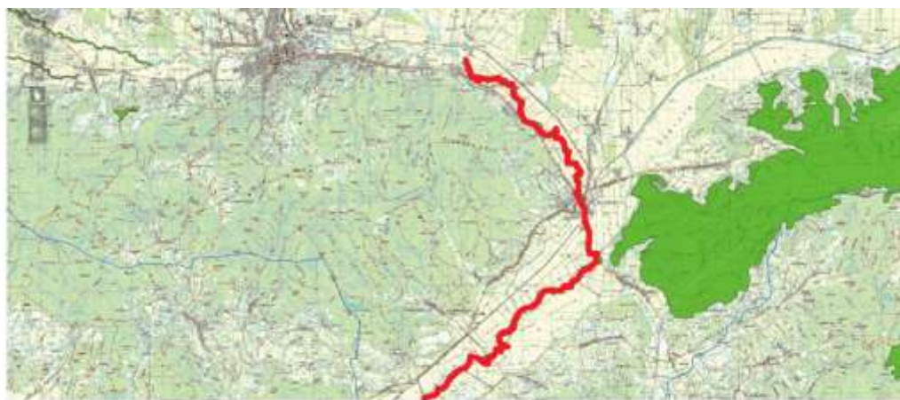
Slika 1. pSCI područje Orjava-crveno, područje Šume na Dilj Gori-zeleno

Prema podacima Državnog zavoda za zaštitu prirode pSCI područje Orjava obuhvaća dio toka rijeke Orjave od mosta na cesti Kuzmica-Blacko-Jakšić do mosta na cesti Brodski Drenovac-Dragovci (slika 1). U sklopu ovog područja zaštićen je stanišni tip Vodni tokovi s vegetacijom Ranunculion fluitantis i Callitricho-Batrachion te školjkaš obična lisanka, Unio crassus (tablica 1).