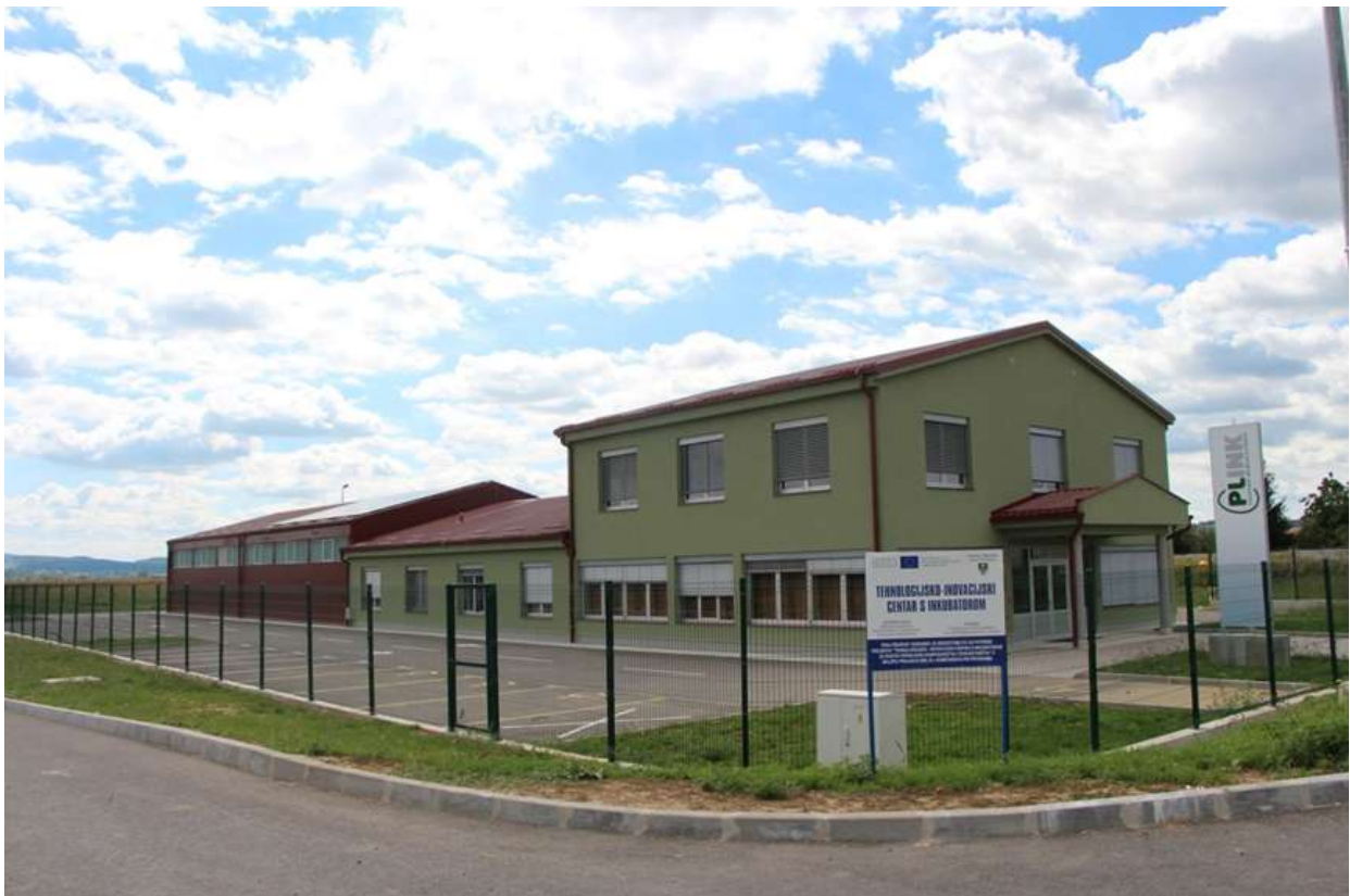
Slika 3. PLINK-Poduzetnički inkubator Pleternica