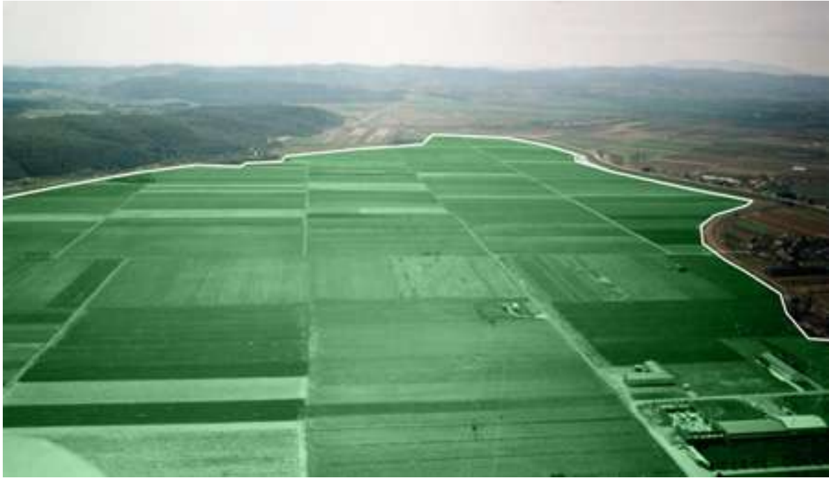
Slika 4. Poduzetnička zona grada Pleternice